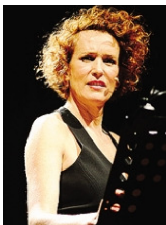
Lucrezia Lante della Rovere